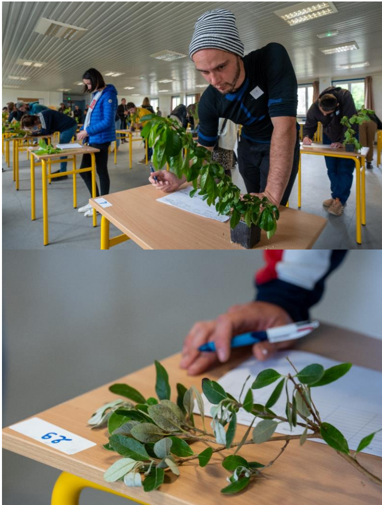
Illustration des épreuves régions concours en salle